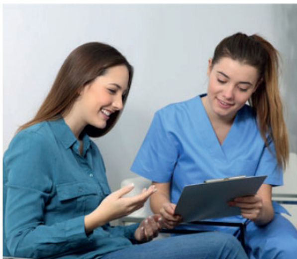
Un questionnaire médical préalable à la pose d'implants sera à remplir par vos soins afin de connaître votre état de santé général.